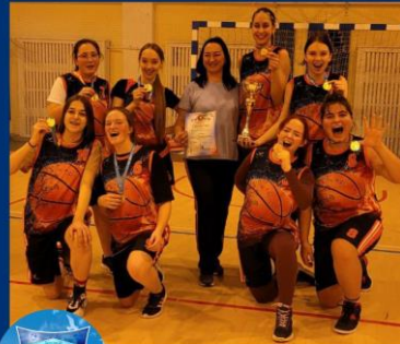
БАСКЕТБОЛ СРЕДИ КОМАНД ДЕВУШЕК 2005-2006