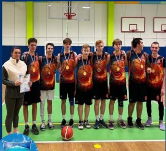
БАСКЕТБОЛ СРЕДИ КОМАНД СТАРШИХ ЮНОШЕЙ