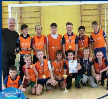
МИНИ-ФУТБОЛ СРЕДИ КОМАНД МАЛЬЧИКОВ 2011-2012 ГОДОВ РОЖДЕНИЯ