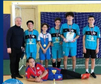
МИНИ-ФУТБОЛ СРЕДИ КОМАНД МАЛЬЧИКОВ 2007-2008 ГОДОВ РОЖДЕНИЯ