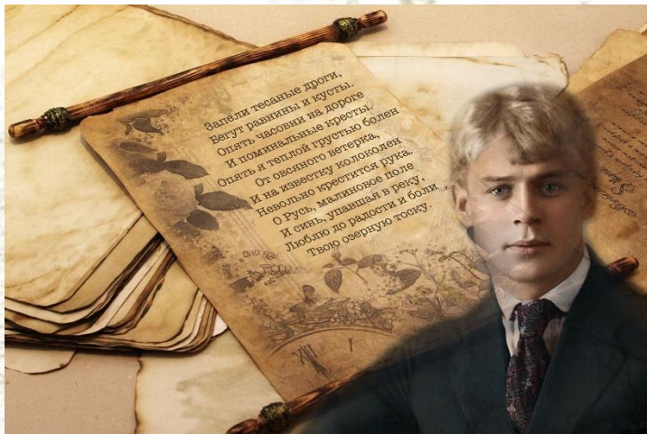
Ушинский Константин Дмитриевич 1823- 1870