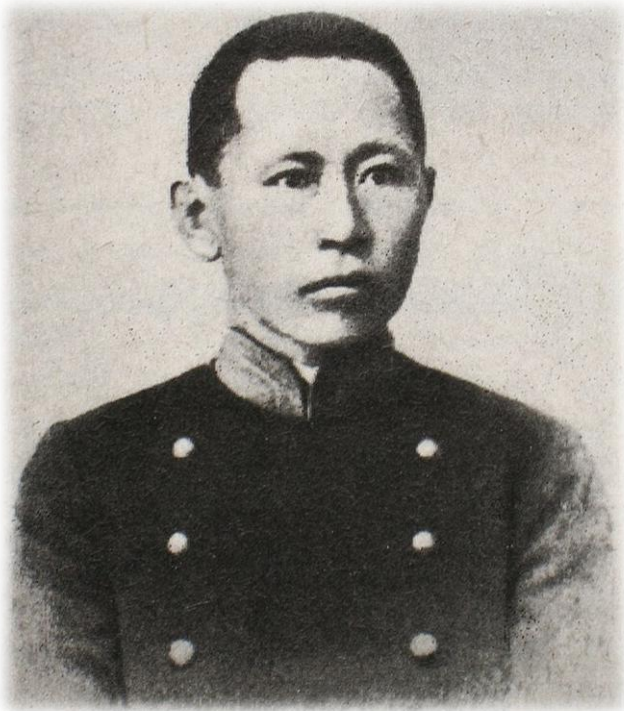
Гомбожаб Цыбиков (19 век)