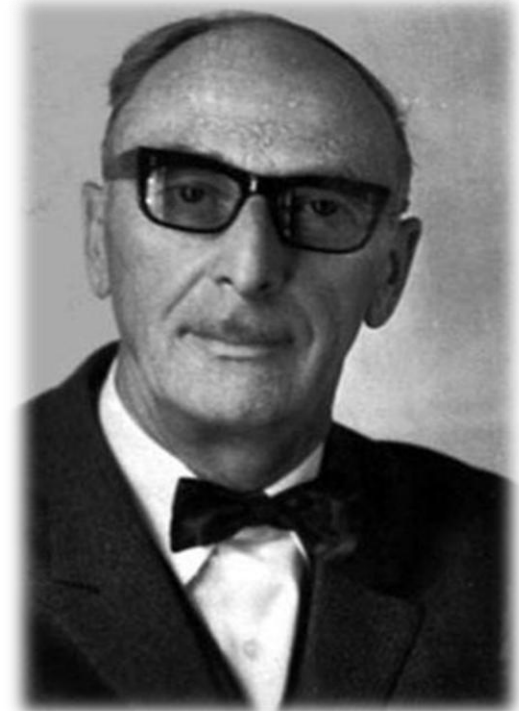
Исаак Ильич Китайгородский (20 век)