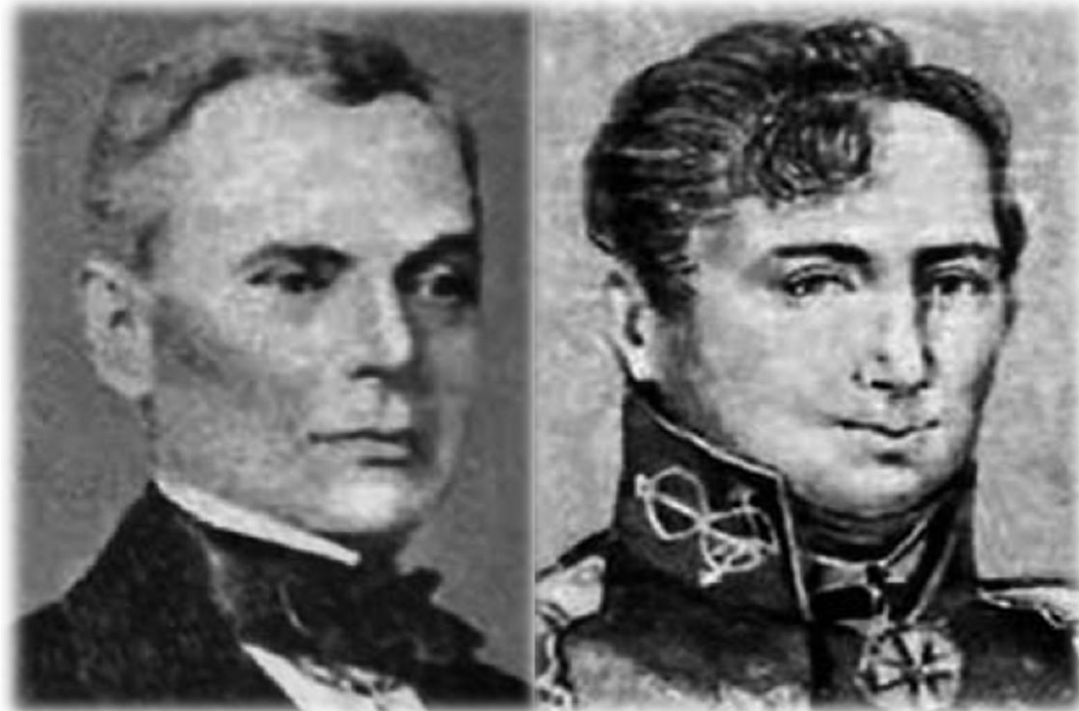
Харитон и Дмитрий Лаптевы (18 век)