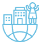
СОЦИАЛЬНЫЕ ЛИФТЫ ДЛЯ КАЖДОГО