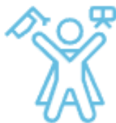
УСПЕХ КАЖДОГО РЕБЕНКА