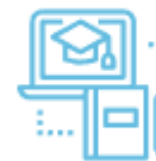
ЦИФРОВАЯ ОБРАЗОВАТЕЛЬНАЯ СРЕДА