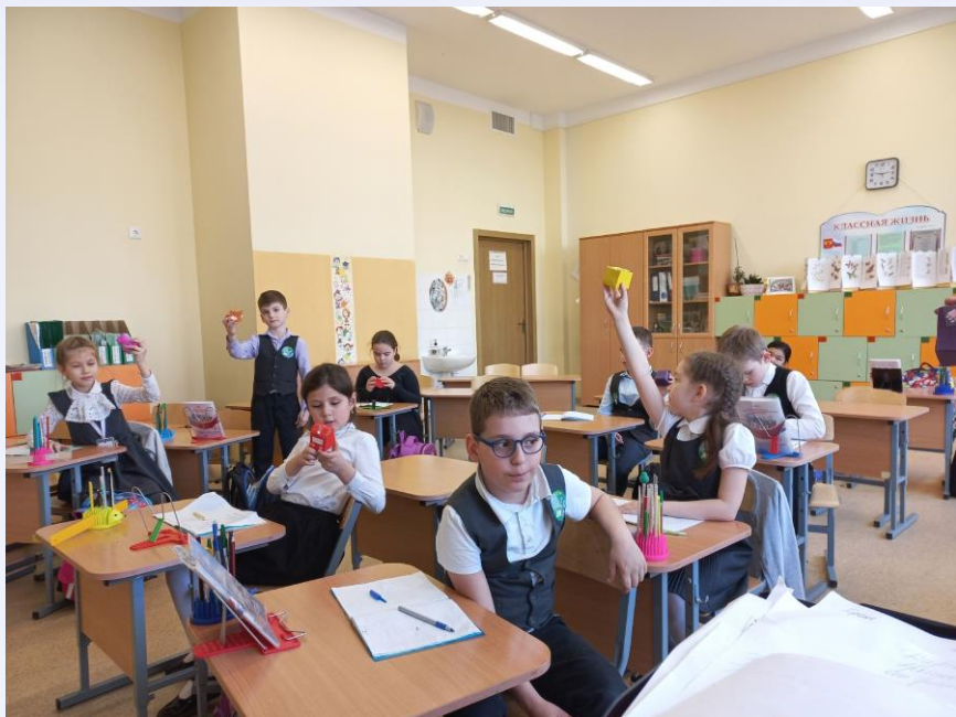
Изготовление копилочек и сбор средств