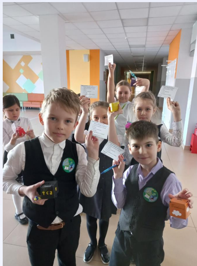
Поход в школьный буфет