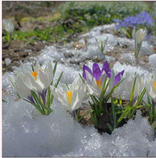
Стихотворение для перевода 7 классов

He calls the pussy willows And whispers in each ear, "Wake up you lazy little seeds: