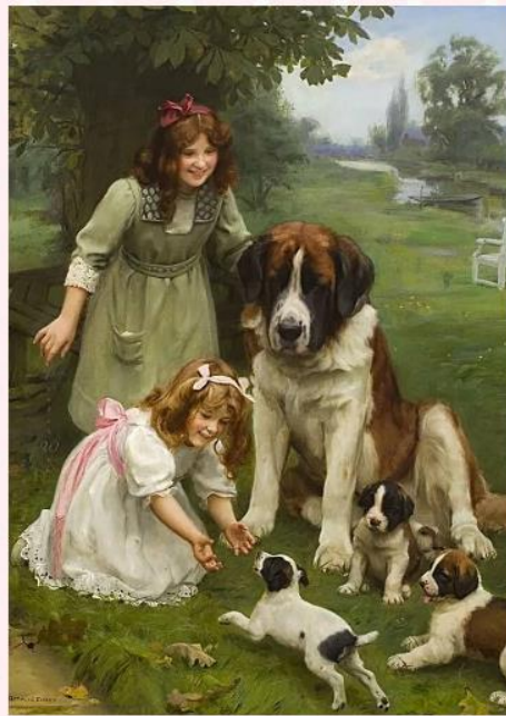
Картина для 8-9 классов