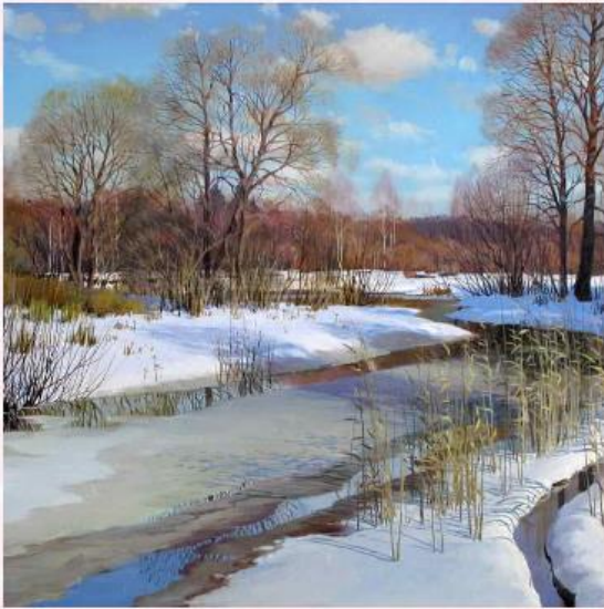
Стихотворение для перевода 6 классов