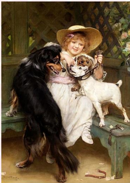
Картина для 7 классов