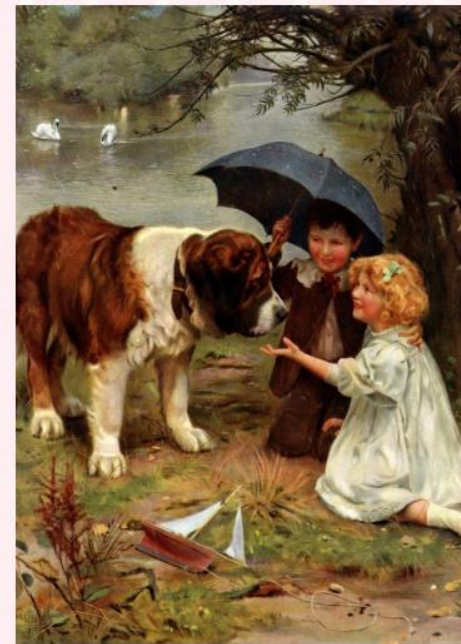
Картина для 10-11 классов