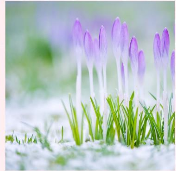
Стихотворение для перевода 8 классов

She shakes the grime from carpet green Till naught but fresh new blades are seen. Then, house in order, all neat as a nin