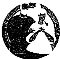
У ПОЖИЛЫХ ЛЮДЕЙ СТАРШЕ 65 ЛЕТ

РИСК ТЯЖЕЛОГО ТЕЧЕНИЯ ГРИППА И ОРВИ ЗНАЧИТЕЛЬНО ВЫШЕ: