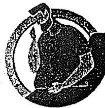
У ЛИЦ, ИМЕЮЩИХ ХРОНИЧЕСКИЕ ЗАБОЛЕВАНИЯ