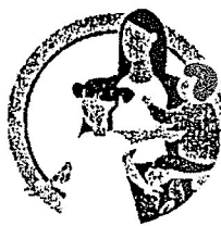
У ДЕТЕЙ ДО 5 ЛЕТ