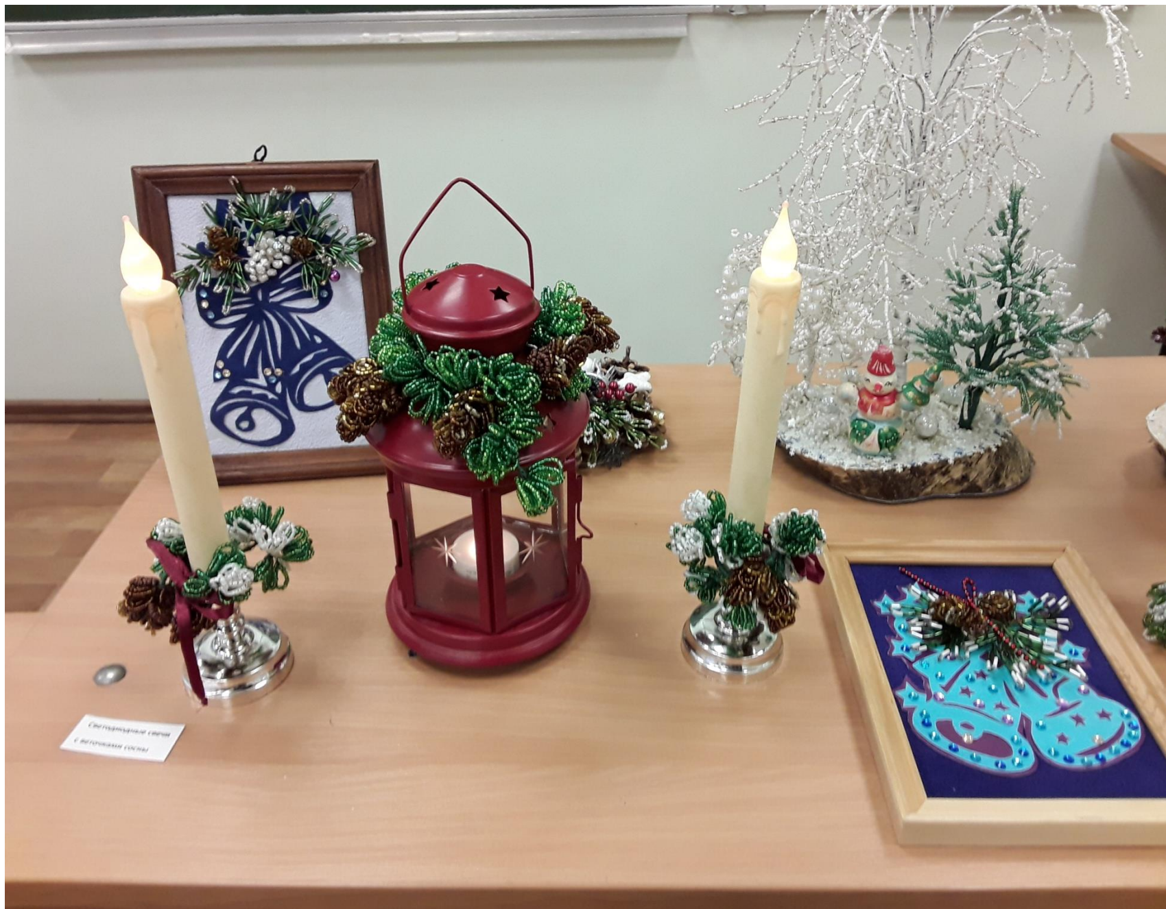
Свечи с веточками сосны