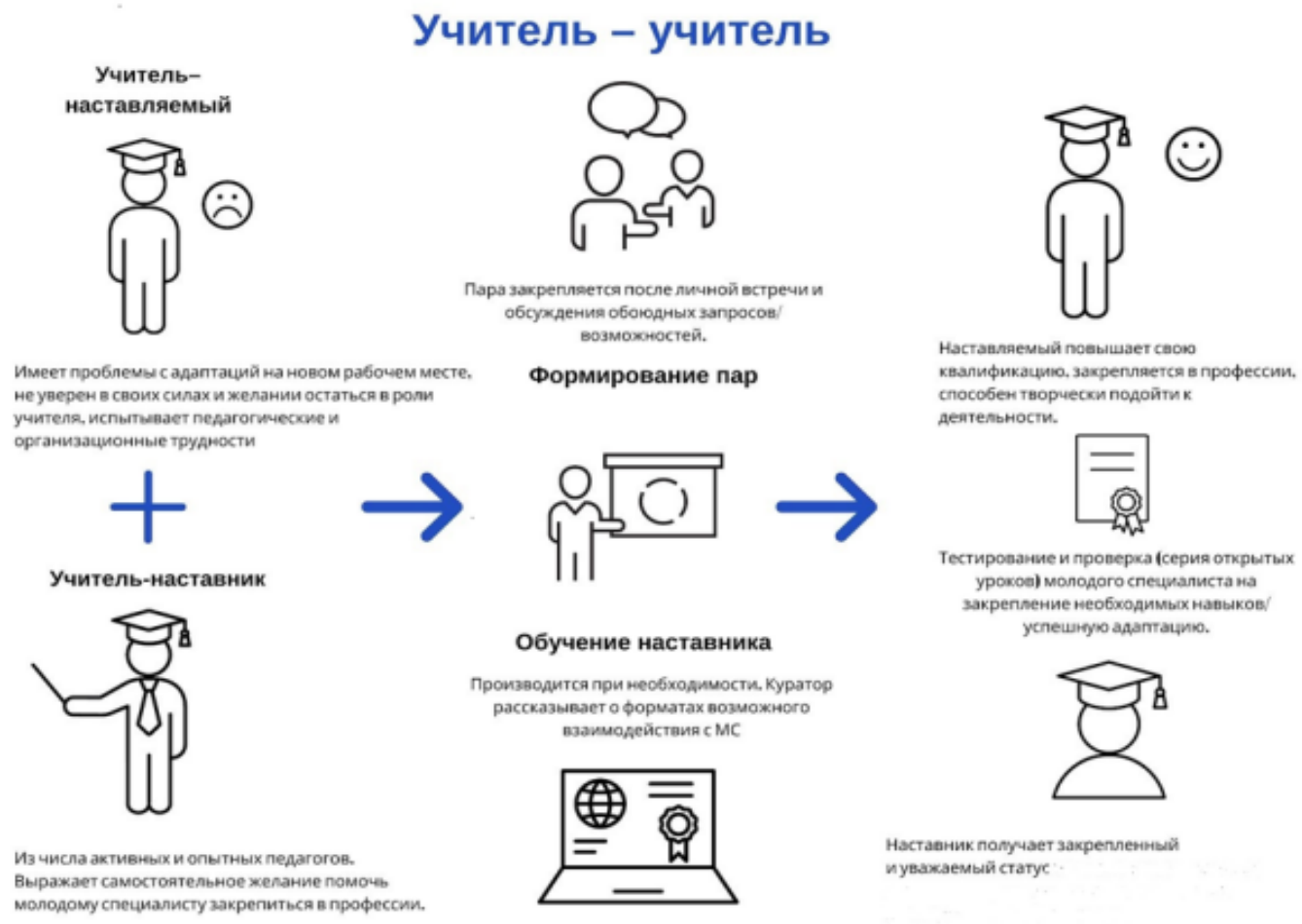
Рисунок 2. Графическое представление взаимодействия по форме «учитель – учитель»